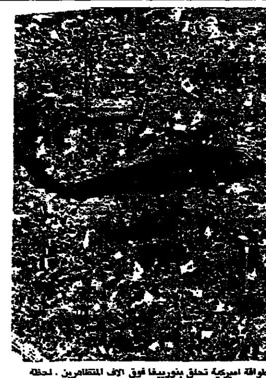
طواقم اميركي تحلق بتورييغا فوق اول القطارين. لحظة استلام التورييغا في العاصمة البنيمة.